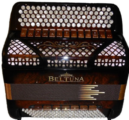
BELTUNA Spirit Classic 3000 Trumpf Buur Radica Gold