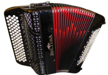
BELTUNA Prestige Plus 3050 MD8 schwarz