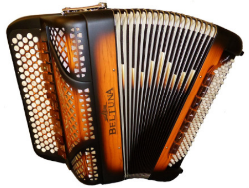
BELTUNA Spirit 3000 Trumpf Buur luxury Ulivo opaco

Das Hochoktav wurde durch einen dritten mittleren reingestimmten Chor ersetzt. So steht dem Spieler nebst dem Tiefoktav im Cassotto (Basson), dem Flötenregister im Cassotto (Clarinet), ein Tremulant vorne ohne Cassotto (Flute) und auch vorne als drittes 8'-Register ein zweites Flötenregister zur Verfügung, das ebenfalls rein gestimmt ist, jedoch viel schärfer klingt. Die resultierende „Doppelflöte“ bestehend aus einer Stimme im Cassotto und einer Stimme ohne Cassotto ist ausserordentlich druckvoll mit viel Durchsetzungsvermögen. Weitere Register bieten sehr schöne, vollklingende Kombinationen. Es gibt das Volksmusik-Tremolo (Musette) mit 2 Stimmen vorne, beide ohne Cassotto, das normale Tremolo mit 1 Stimme im Cassotto und Tremulant vorne. Die Doppelflöte mit dem Tremulanten zusammen ist das neue „Power-Tremolo“, das 3-chörig voll und rein klingt.