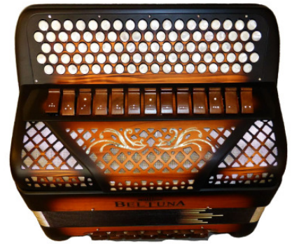
BELTUNA Spirit 3000 Trumpf Buur luxury Ulivo opaco