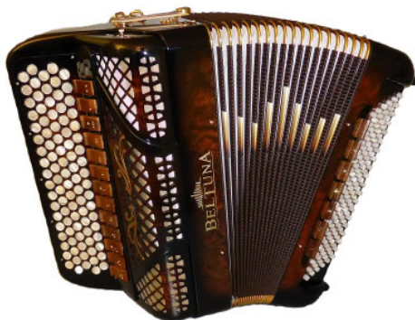
BELTUNA Spirit Classic 3000 Trumpf Buur Radica Gold