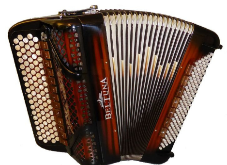
BELTUNA Spirit Classic 3000 Trumpf Buur wood shadow