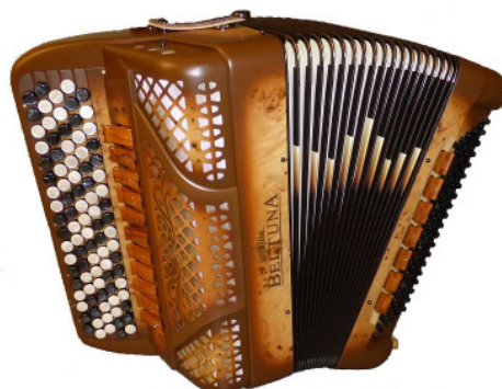
BELTUNA Spirit Classic 3000 Cappuccino

Spielt man eine Oktave höher, sind die Registerkombinationen mit Tiefoktave fein abgestimmt und reizvoll. Vom Schwyzerörgeli-ähnlichen Klang mit aggressiven Höhen, über herrliche Tango-Register bis hin zu weichen und jazzigen Klängen ist die Vielfalt sehr gross.